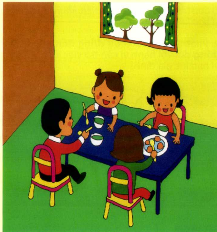
*ảnh sưu tầm

2. Phạt tiền từ 300.000 đồng đến 500.000 đồng đối với hành vi thường xuyên đe dọa bằng bạo lực để buộc thành viên gia đình ra khỏi chỗ ở hợp pháp của họ.