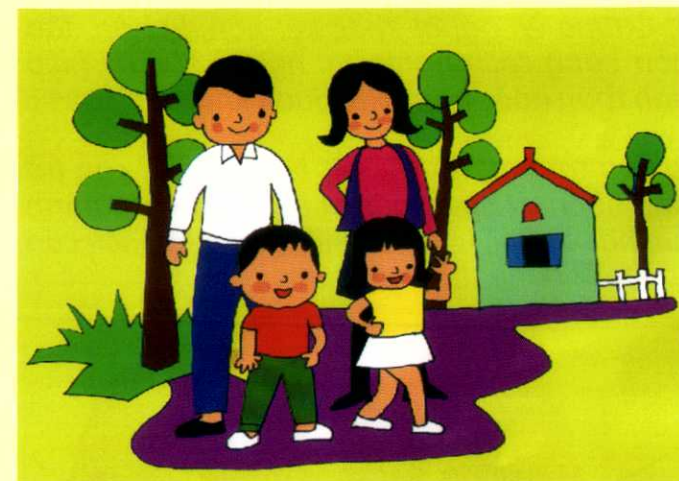
*ảnh sưu tầm